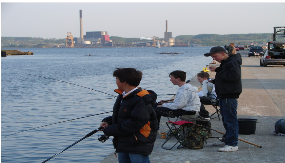
Juniorer på havnen